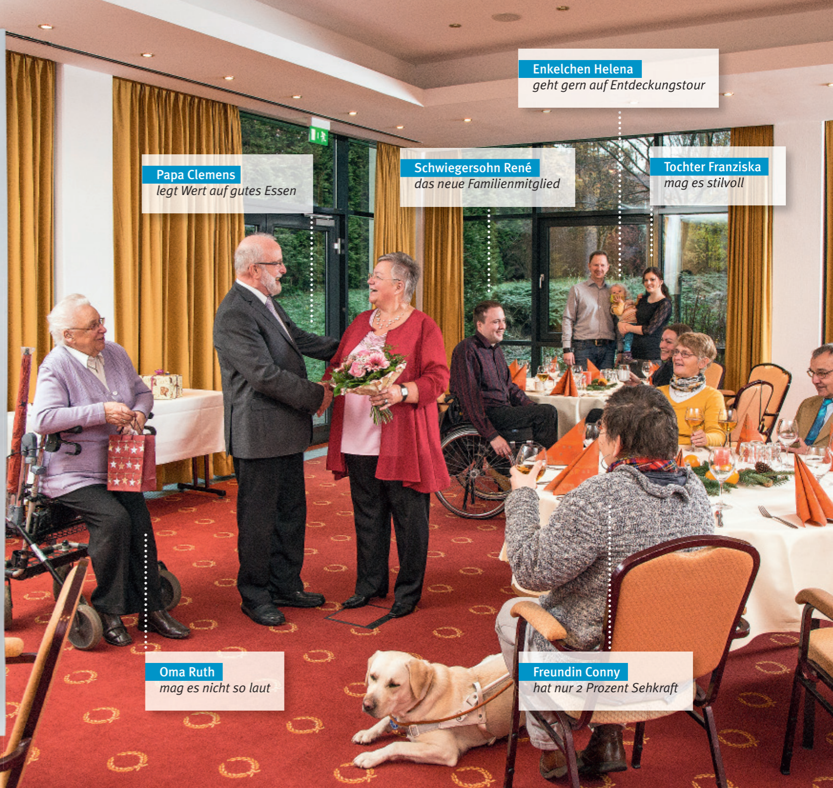
Papa Clemens legt Wert auf gutes Essen